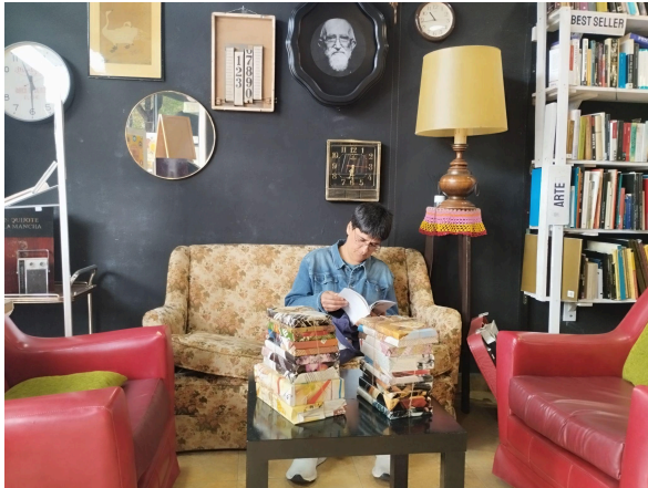
Trapu-liburuak bisita. Liburutegi zirkularra