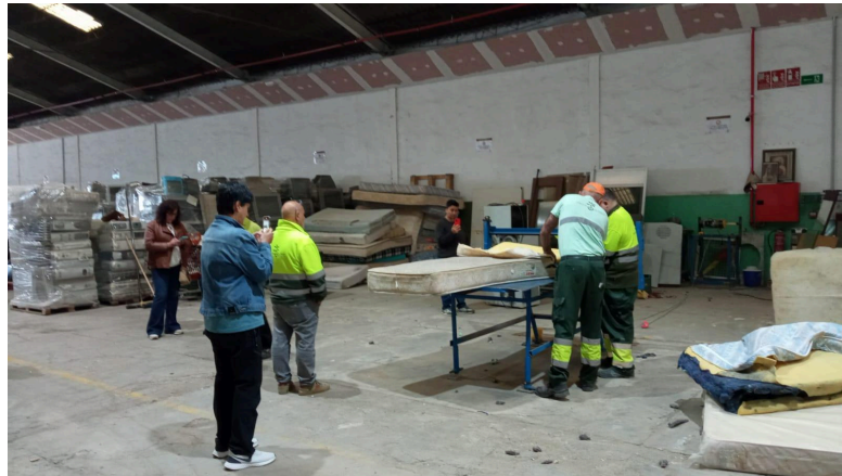
E.I. Traperos Recicla SL

Murtziako Emauseko Trapuketarien Elkartearen (Recicla Traperoen erakunde sustatzailea) bigarren eskuko saltokiak ere bisitatu ziren, ekonomia zirkular, sozial eta solidarioarekin lotutako lan-esparru eta funtzionamendu-metodo guztiak partekatzeko.