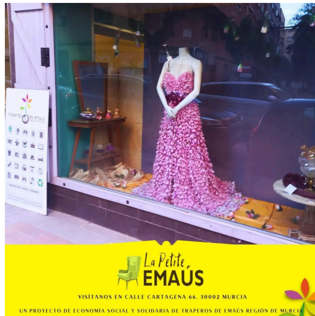
La Petite Emaus bisita

Murtziako Emauseko Trapuketarien Elkartearen (Recicla Traperoen erakunde sustatzailea) bigarren eskuko saltokiak ere bisitatu ziren, ekonomia zirkular, sozial eta solidarioarekin lotutako lan-esparru eta funtzionamendu-metodo guztiak partekatzeko.